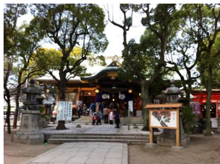
近所の高津神社に初詣に行きました

今年は本当に寒いですね。暦の上ではようやく大寒が過ぎました。次は立春です。春という文字を見るだけで心が弾みます！お身体ご自愛いただき、風邪等ひかれませぬよう、暖かくお過ごしくださいませ。