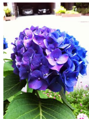
ブルーとパープルのハーフ&ハーフ