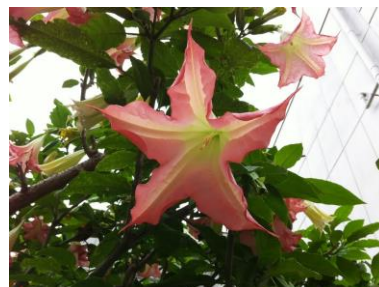
エンジェルランペット かわいい名前ですが、毒があります

株式会社ユニコーン 大阪市中央区大手通 1-1-2 TEL.06-6943-4560 FAX.06-6920-5311