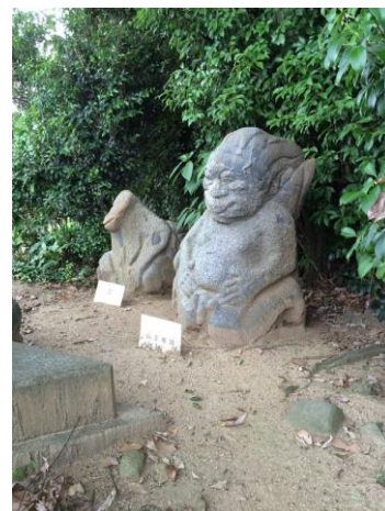
猿石とよばれる石像。右が山王権現 左が女 と記されています。