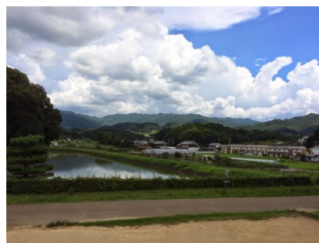
飛鳥駅前からレンタルサイクルで ぐるっと散策。 見所がたくさんありますが 早々に疲れて大方スルーしました。