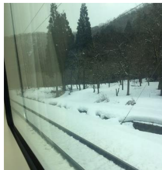
窓の外は雪国・・・。