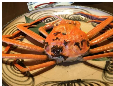
美味しかったです♪