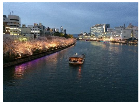
大川の夜桜クルージングを上から眺めました