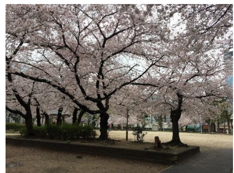
今年もお花を見られてしあわせです。