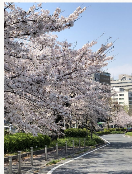
平成最後の桜の花