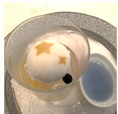
星組にちなんで 星がちりばめられた お料理でした！！