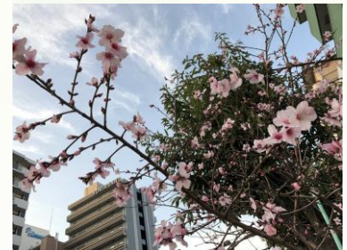
アーモンドのお花