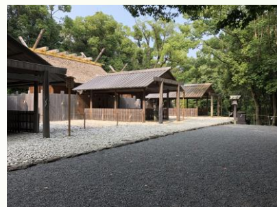
月讀宮、お社が4つ並んでいます。

今月も最後まで読んで頂きまして、 ありがとうございました。 来月もよろしく願っています。