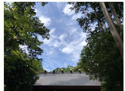
お天気に恵まれました！