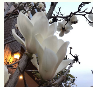
木蓮が咲くと「春が来るなー」って感じます