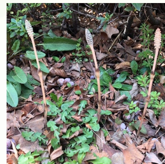
何年かぶりにつくしにも出会えました