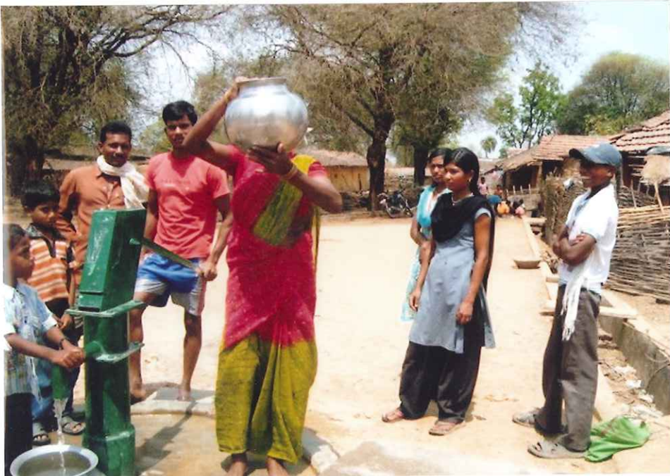
水を運ぶ 村の女性