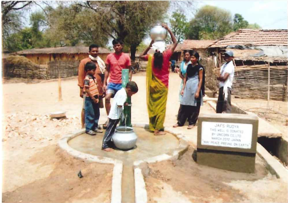
井戸から 水を運ぶ 村の女性