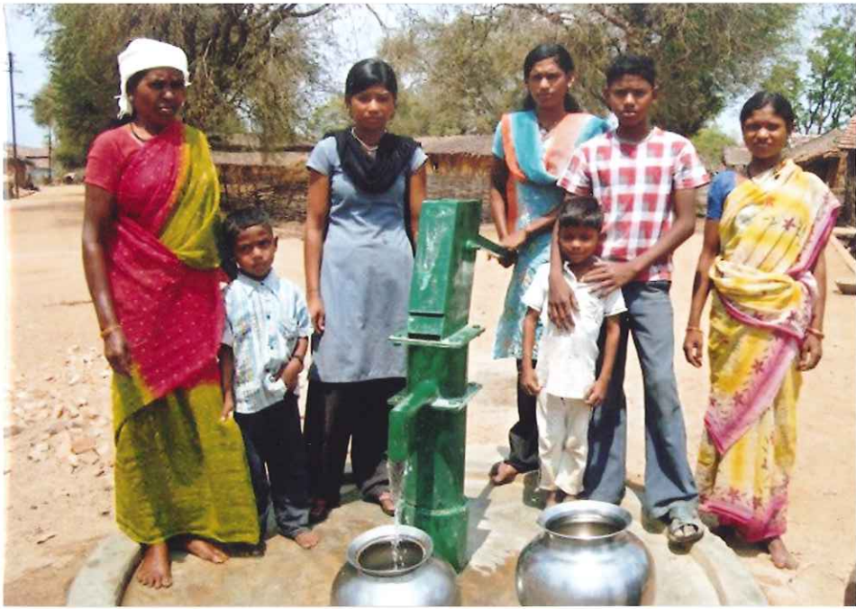
井戸と村の 人たち