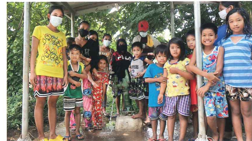
ヌエバエシハ州ジェネラルマメルトナティビダード町マナログ村 受益者：21世帯100人 井戸の形式：ポンプ式（深さ30m）

井戸が寄贈され、村で安全な水を得ることが可能になりました。村人にとって、毎日十分な水を飲むことができ、家族が健康で過ごせることは、何物にも代えがたい大きな喜びです。