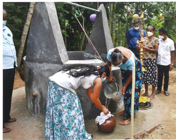
ザバラガムワ州ラトゥナプラ県ゲイジャヤ・ヤヤ2村 受益者：16世帯85人 井戸の形式：露天式（深さ8m）

この村には村人が掘った古い井戸が一つありましたが、水量がとても少なく、遠くの池まで日々の水をくみに行かなければなりません。水質もとても悪く、水が原因で健康を害する村人が多くいました。しかし、汚れている水と分かっていても、他に水を得られる手段がなく、その水を使わざるを得ませんでした。井戸ができ、村の中で安全な水が得られるようになり、村人たちは心から喜んでいました。井戸周辺のプラットフォーム作りや道路整備は村人が協力して行いました。