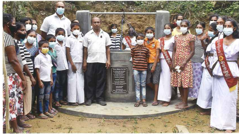
ザバラガムワ州ラトゥナプラ県ワラルゴダピサミトゥラ村 受益者：20世帯140人 井戸の形式：露天式（深さ10m）

長年、安全な水が飲める井戸を待ち望んでいた村人は、井戸の建設にとっても協力的で、技術者がする作業以外には、民族・宗教の違う多くの村人がともに働き、井戸周辺のプラットフォーム作りや道路整備をしました。子どもたちが中心になって、井戸の周りに、水を浄化し保水する力がある木々の植林も始めました。木々を育てることによって、緑多い土地をよみがえらせ、井戸の水を枯らさず、また、土砂崩れなどの自然災害からも村を守ってくれます。心から感謝します。