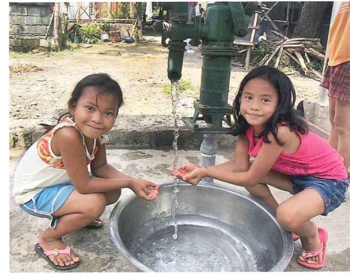
ヌエバエシハ州ジェネラルマメルトナティビダード町タラプタノルテ村 受益者：26世帯130人 井戸の形式：ポンプ式（深さ30m）

この村には古い浅井戸が1基ありましたが、水は茶色く濁っており不純物も多く、濾して煮沸していましたが、飲むのは難しい水でした。個人で井戸を持っている村人もいましたが、水量が十分でなかったため、常時分けてもらうことはできませんでした。女性や子どもにとって、遠くのため池や農業用水路での早朝からの水くみは重労働でした。この度、井戸をご寄贈くださったおかげで、村で安全な水を十分に得ることができるという初めての体験に、感謝でいっぱいです。