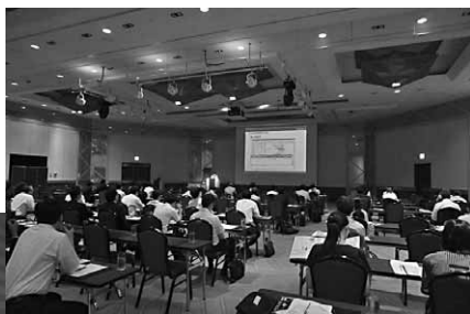
120名のホテル・式場関係者が 集まりにぎわいを見せた