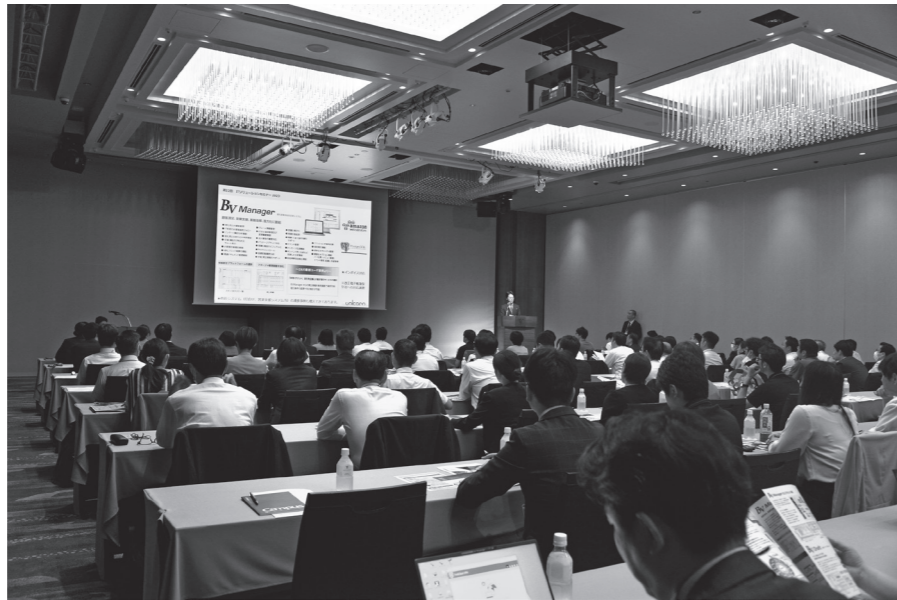
会場には約120名の業界関係者が集結。BVSystemシリーズの最新動向に耳を傾けた

予約情報、見積情報、精算、売上・売掛、手配などを担う基幹システム「BVManager」と、営業情報、見込顧客、予算管理などを担う「BVSales」