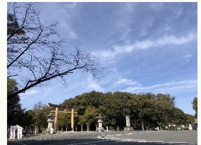
気持ちの良い青空〜♪

春は近しいといえどもまだまだ寒さが続く事とおもいます。 みなさまもどうぞ暖かく心地よく、心も体も健やかに過ごしてくださいませ。