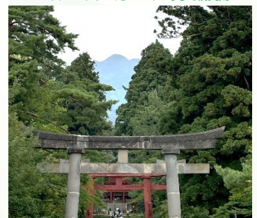
鳥居越しの岩木山

今月も最後まで読んで頂きまして、 ありがとうございました。 来月もよろしくお願ひいたします。