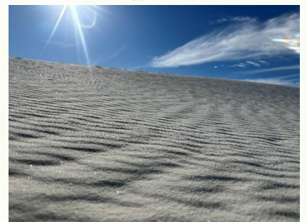
砂紋もうつくしい