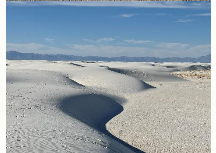
ずっと続いていく砂丘